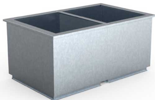
Takgenomföring för Hagabs kombihuvar.