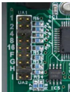
Bild utvisande bygel H och 4 är på. (Betyder fristående drift och endast spjällgrupp 1 används.)